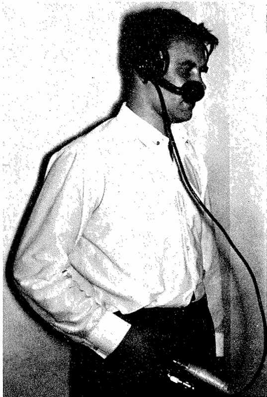
Pintamiehen kuuloke- ja mikrofonilaitteet sekä äänenvahvistin.

Kädessä pidettävä äänenvahvistin on täysin transistoroitu ja sen voimanlähteenä toimii kaksi Mallory TRI-33 4 voltin elohopeakennoa. Tämä laite on kestävässä, vesitiiviissä, Epoxy-hartsista valmistetussa kotelossa, mitat 15,5 cm × 9 cm × 4,5 cm.